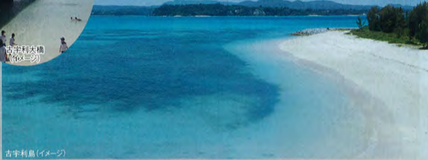
古宇利島(イメージ)