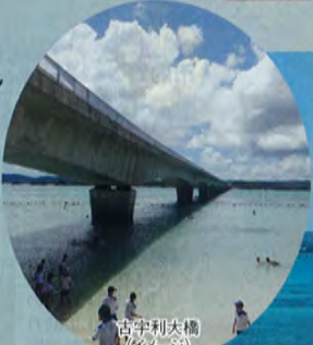
古宇利大橋(イメージ)