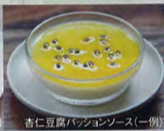
杏仁豆腐パッションソース(一例)