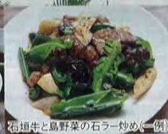
石垣牛と島野菜の石ラー炒め(一例)