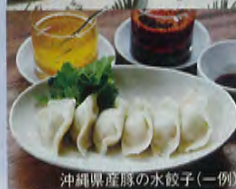
沖縄県産豚の水餃子(一例)