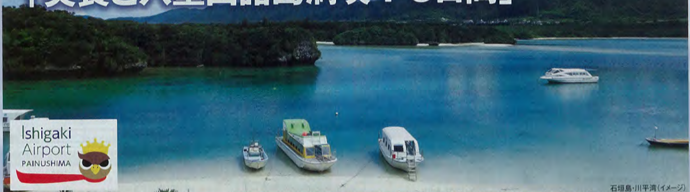
石垣島・川平湾(イメージ)