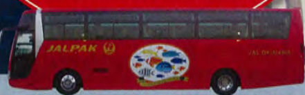
JALライナー(イメージ) *写真と異なる場合があります。