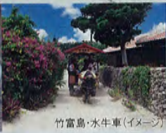
竹富島・水牛車(イメージ)